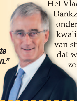
GEERT BOURGEOIS, viceminister-president van de Vlaamse Regering

“Er ligt een hervorming op tafel die het goede van het Vlaamse onderwijs behoudt en tegelijk de knelpunten wegwerkt met concrete maatregelen.”