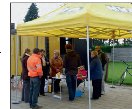
De Luistertour houdt halt in Houtvenne.

Op zaterdag 9 november 2013 kwam de N-VA naar je toe. Met onze luister-toer hielden we halt in elk dorp van onze gemeente. Wij willen graag naar onze inwoners luisteren, ook buiten de verkiezingsperiode. Heel wat inwoners kwamen langs op ons standje met hun verhalen, vragen, klachten, wensen en voorstellen. Wij noteerden alles zorgvuldig en gaan er verder mee aan de slag in de gemeenteraad en de OCMW-raad, waar wij jullie stem willen vertegenwoordigen.