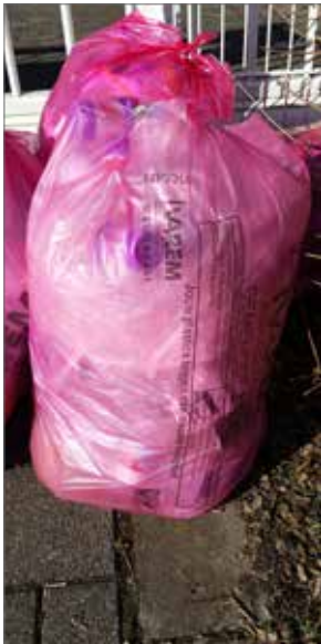
▲ De N-VA is voorstander van gescheiden plastic-ophaling.

Een tijdje geleden lanceerde de gemeente een oproep aan 30 Hulshoutse gezinnen om gedurende de 30 juni-dagen 30 procent minder restafval te produceren. Een nobel initiatief, ware het niet dat we in Hulshout niet met gelijke wapens strijden als in andere gemeenten.