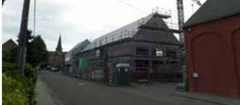
Akkoord over nieuwe lokalen Schoolstraat p.2