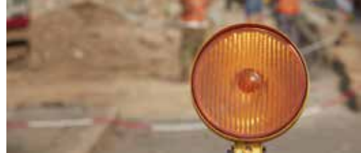
Hinderpremie voor handelaars p.3